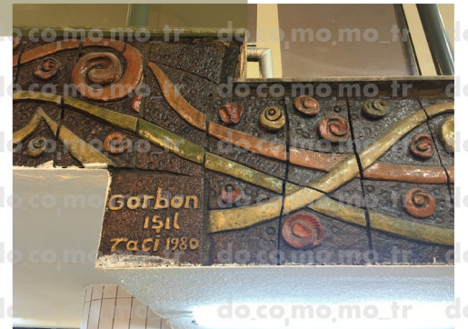
sürekli/bant seramik panolar