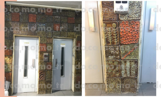
karo seramik panolar